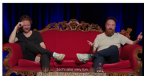
Training Manual for Trainers: Integrating Videogaming in Theater Performance | CULTUURCONNECT