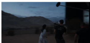
Training Manual for Trainers: Virtual Production - Principles of Video Recording in 3D Virtual Scenery | CULTUURCONNECT