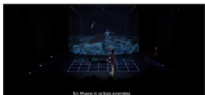
Training Manual for Trainers: Live AI Prompting & Visual Interaction in Performance | CULTUURCONNECT